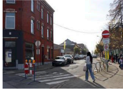
La rue Boch ne sera plus en sens interdit depuis le Gazomètre.

« Ce test engendre en effet plus de désagréments que d'avantages. Nous tenons compte dans notre décision de l'avis des riverains, de la sécurité dans ce quartier et du report du trafic sur la périphérie de ce dernier. Finalement, cette situation crée aussi moins de places de parking qu'au préalable et plus d'embouteillages rue du Gazomètre et au carrefour de l'Olive avec un risque d'accidents plus accru », complète l'échevin. Olivier Destrebecq entend