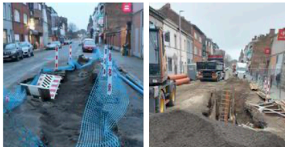
Wanty est à la manœuvre

Une dizaine de mètres de longueur, près de 2 m de largeur